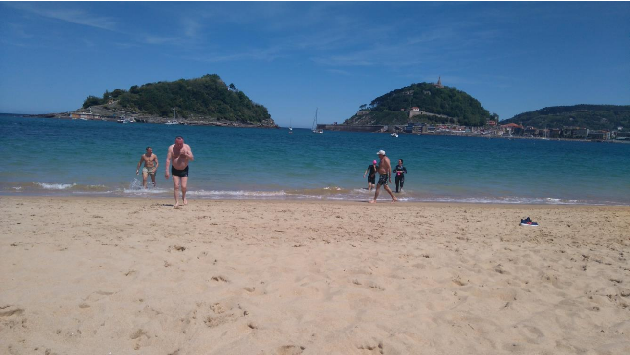
Kuvassa San Sebastian upea ranta

Sebastianin kaupunkiin. Valittu maailman kauneimmaksi ranta-/rantabulevardiksi. Tänne koko 8-hengen ryhmä haluaisi tulla uudestaan. Illastimme vanhassa kaupungissa Parte Vieja maittavien Tapaksien ja Rioja viinin kera-Bon Apetit! Hotelli Codina kaksi yötä San Sebastianissa.